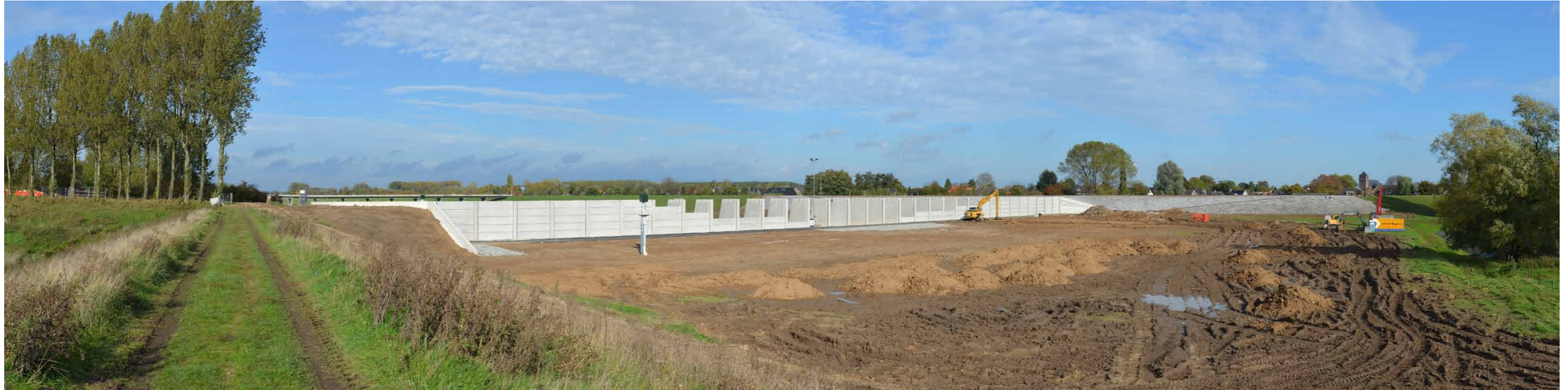
B 4 Regelwerk Pannerden, zomerdijk, 26 oktober 2013