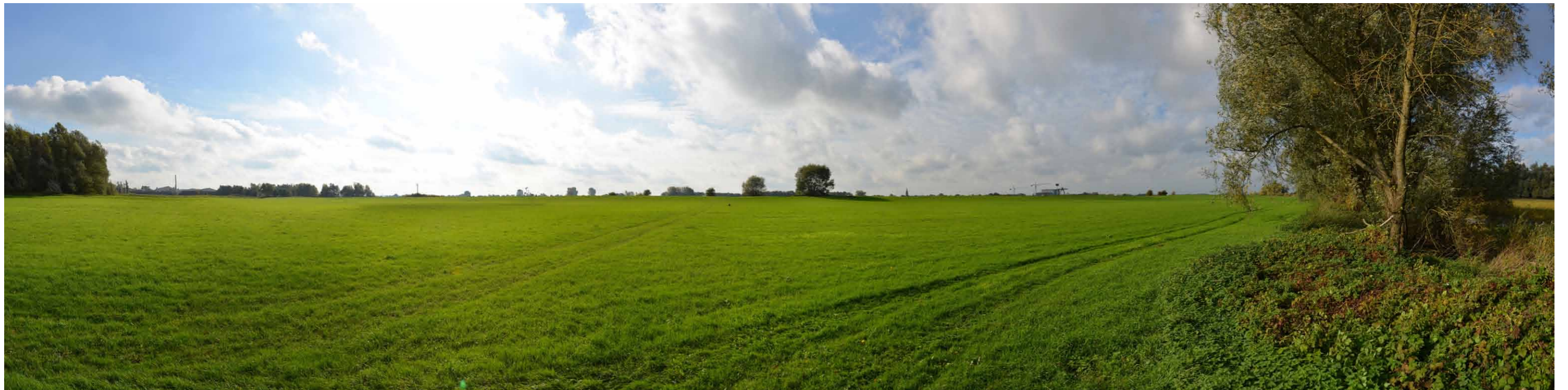
D 2 Oevergeul Boven-Rijn, aan bosrand, 26 oktober 2013