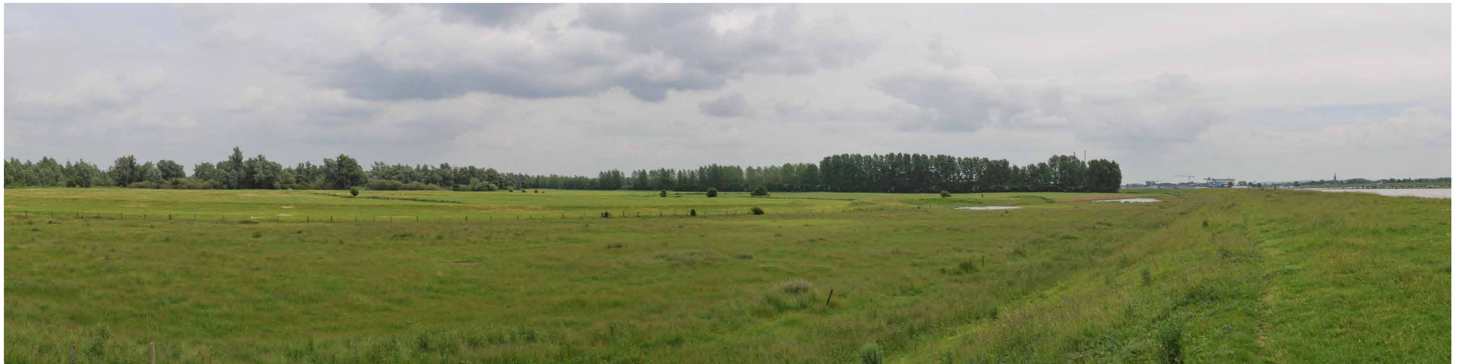
C 3 Lobberdensche Waard, zomerdijk, 14 juni 2013