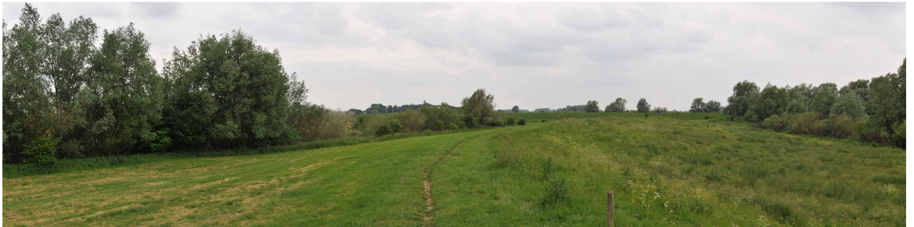
C 1 Lobberdensche Waard, Zorgdijk, 14 juni 2013