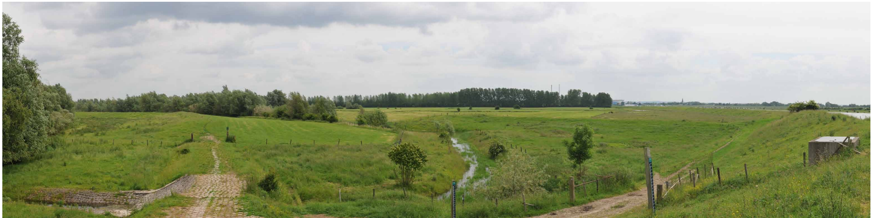
C 2 Lobberdensche Waard, zomerdijk, 14 juni 2013