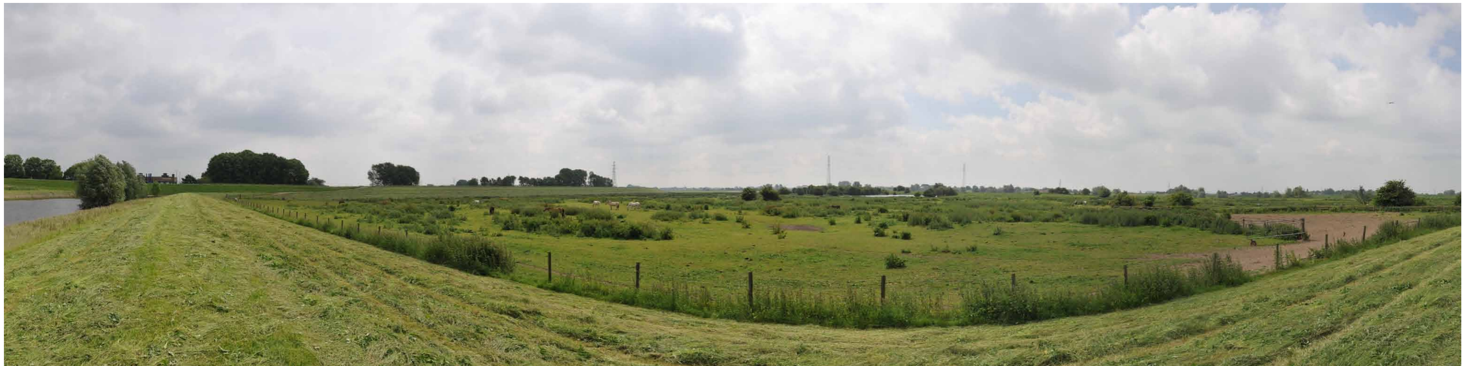
A 2 Groene rivier strang, kade nabij gemaal Kandia, 14 juni 2013