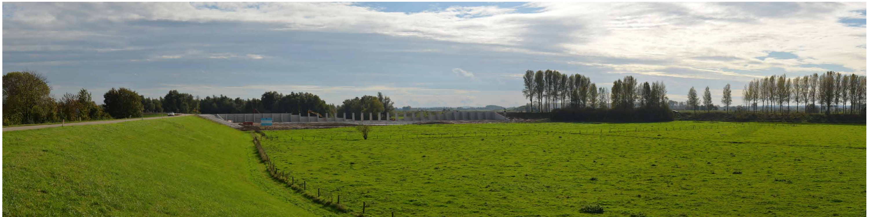
B 1 Regelwerk Pannerden, brug naar veer, 26 oktober 2013