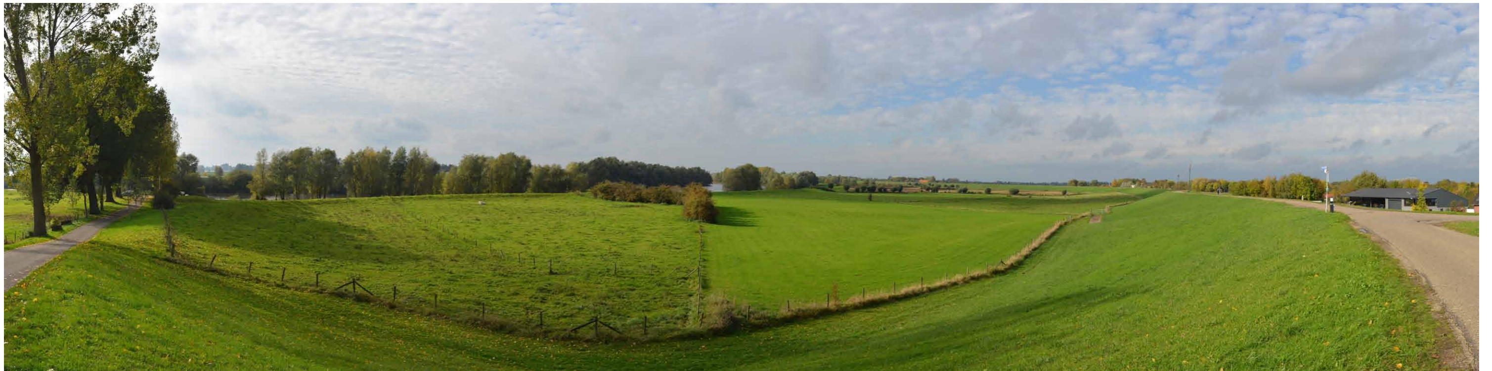
E 6 Geitenwaard, hoek Herwense Dijk en Puttmanskrib, 26 oktober 2013