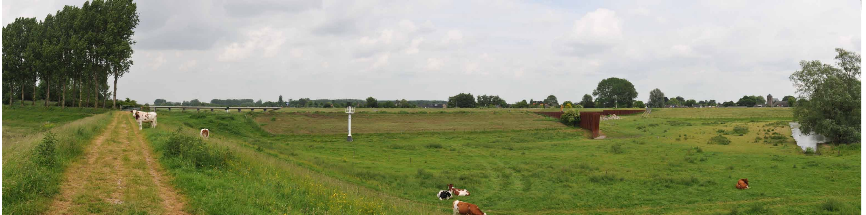
B 4 Regelwerk Pannerden, zomerdijk, 14 juni 2013