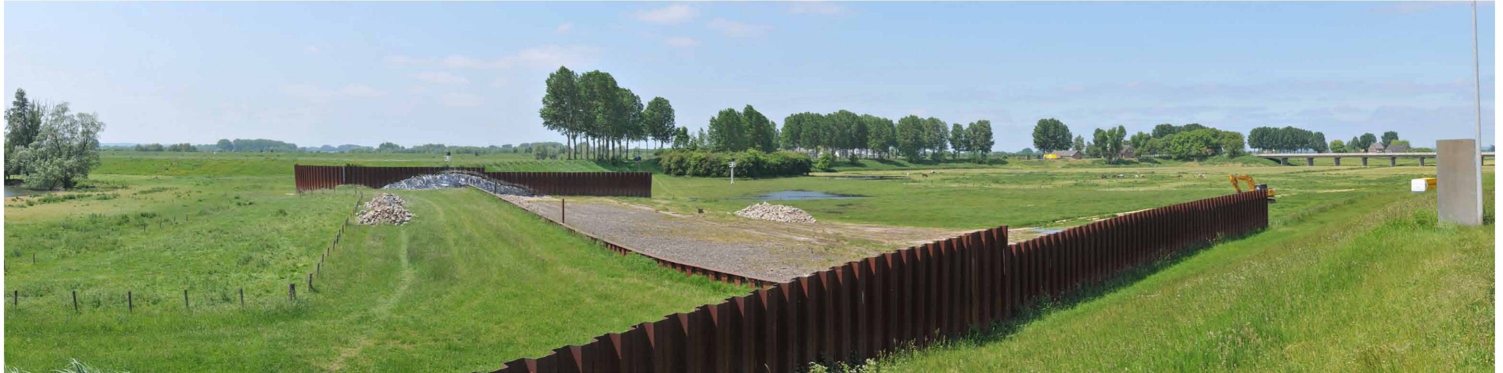
B 2 Regelwerk Pannerden, Rijndijk, 9 juni 2013