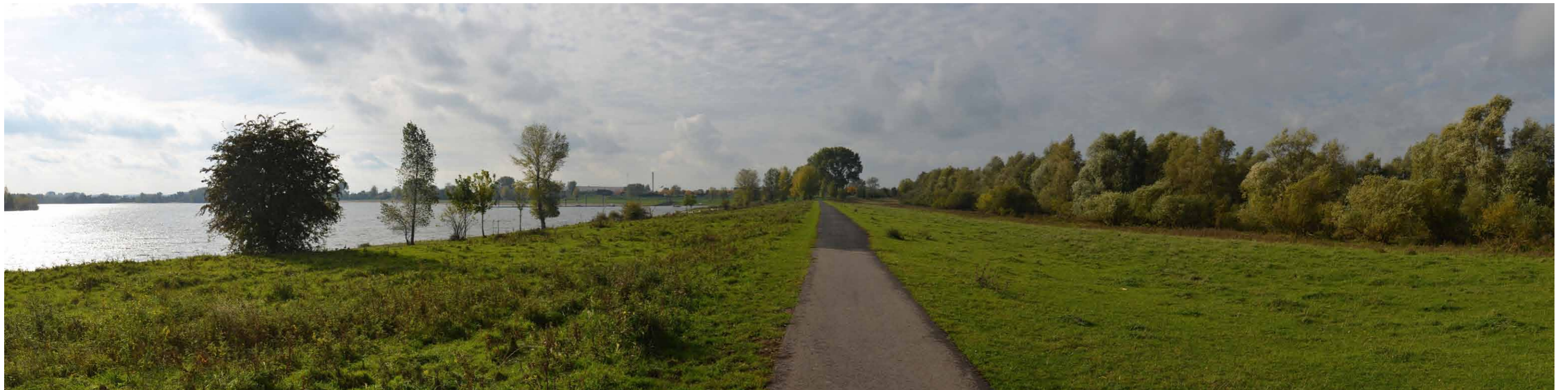
F 1 De Bijland, westoever, 26 oktober 2013