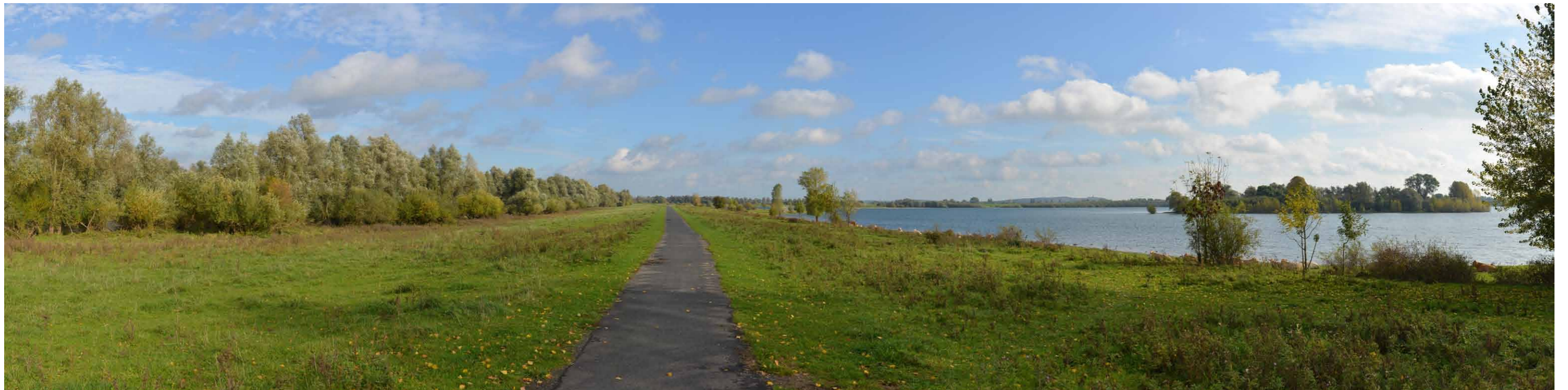
F 2 De Bijland, westoever, 26 oktober 2013