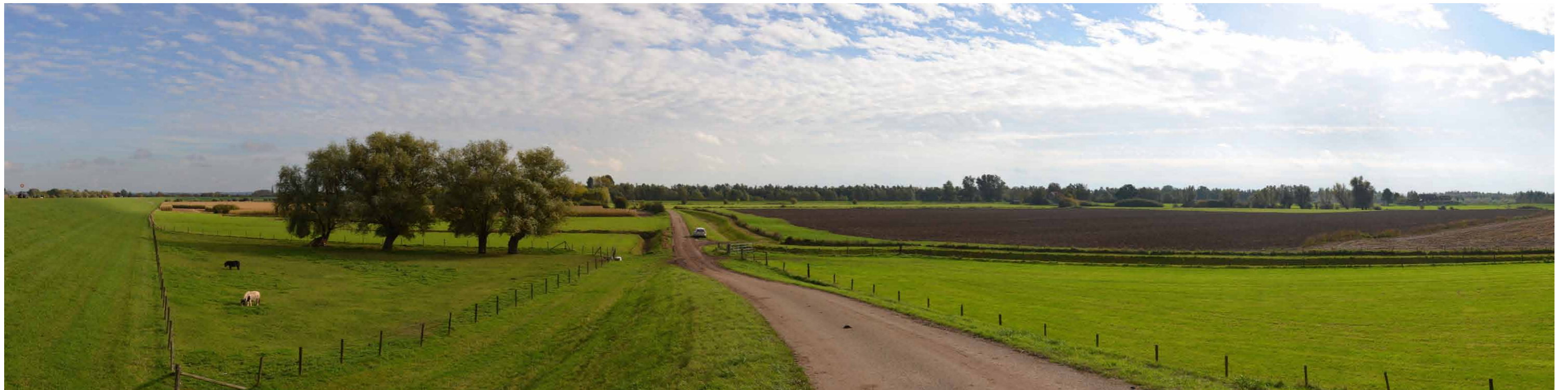
E 3 Geitenwaard, vanaf winterdijk, 26 oktober 2013