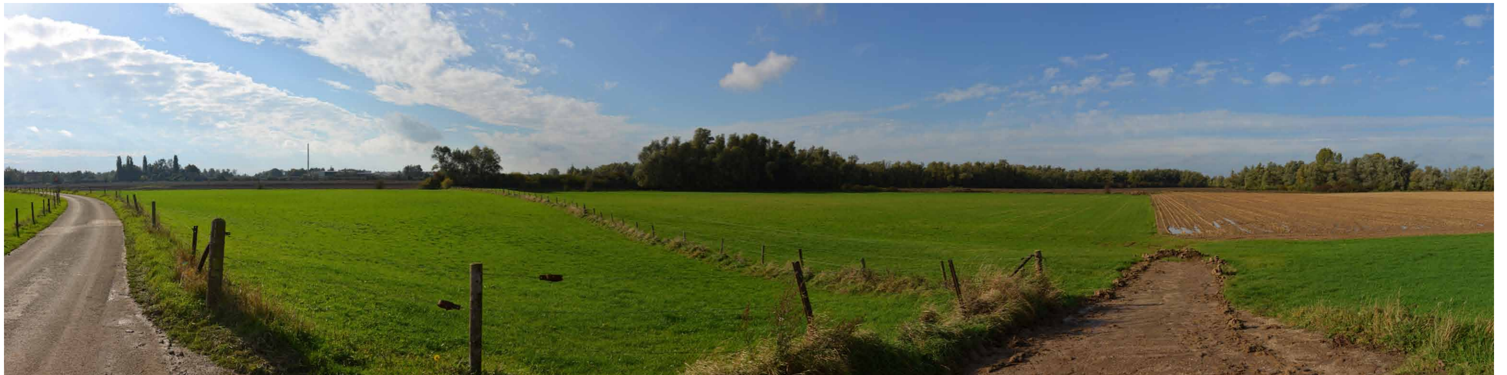
E 1 Geitenwaard, Geitenwaardse Dam, 26 oktober 2013