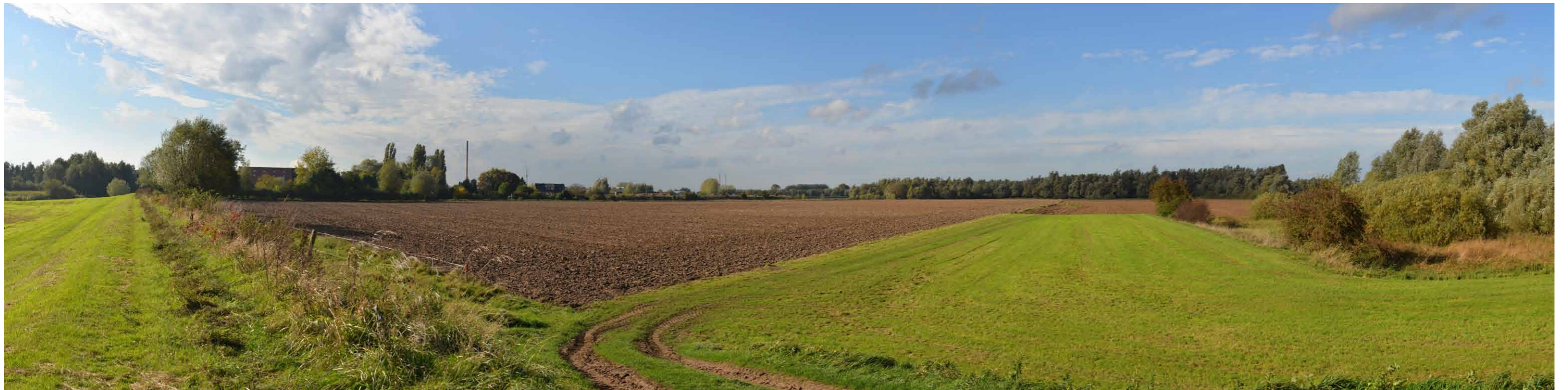
E 2 Geitenwaardse Dam, 26 oktober 2013