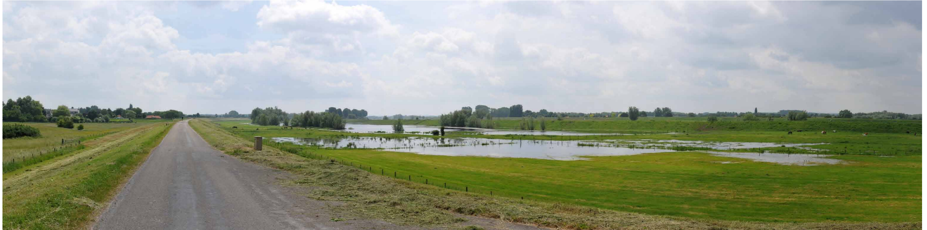
A 6 Groene rivier strang, Pannerdensche Waard, 14 juni 2013