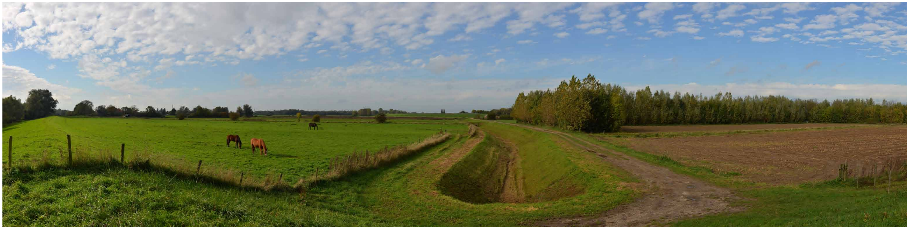
E 4 Geitenwaard, vanaf winterdijk, 26 oktober 2013