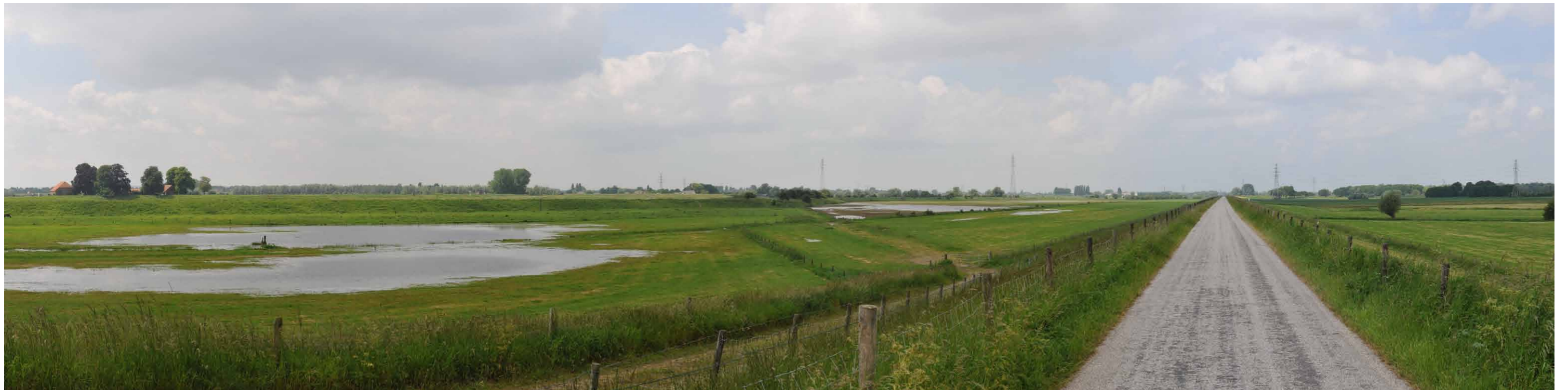
A 4 Groene rivier strang, Pannerdensche Waard 14 juni 13