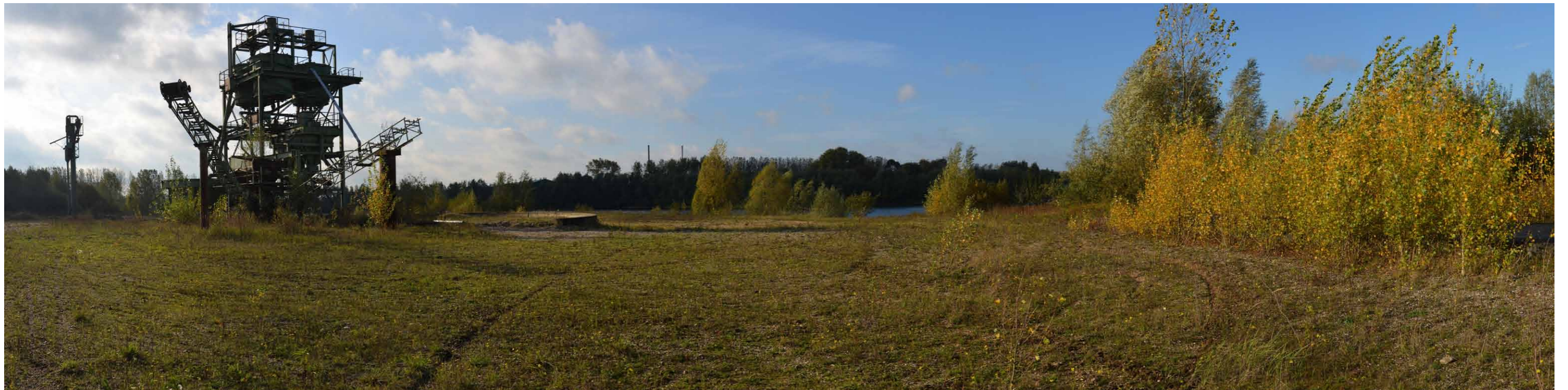
C 4 Lobberdenseweg, Plas Wezendonk, 26 oktober 2013