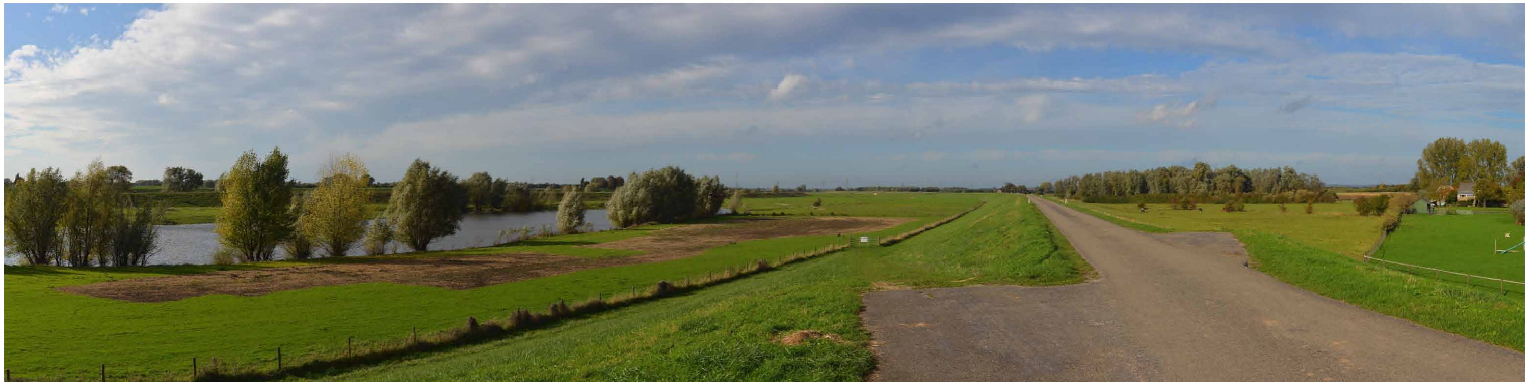
A 7 Groene rivier strang, 26 oktober 2013