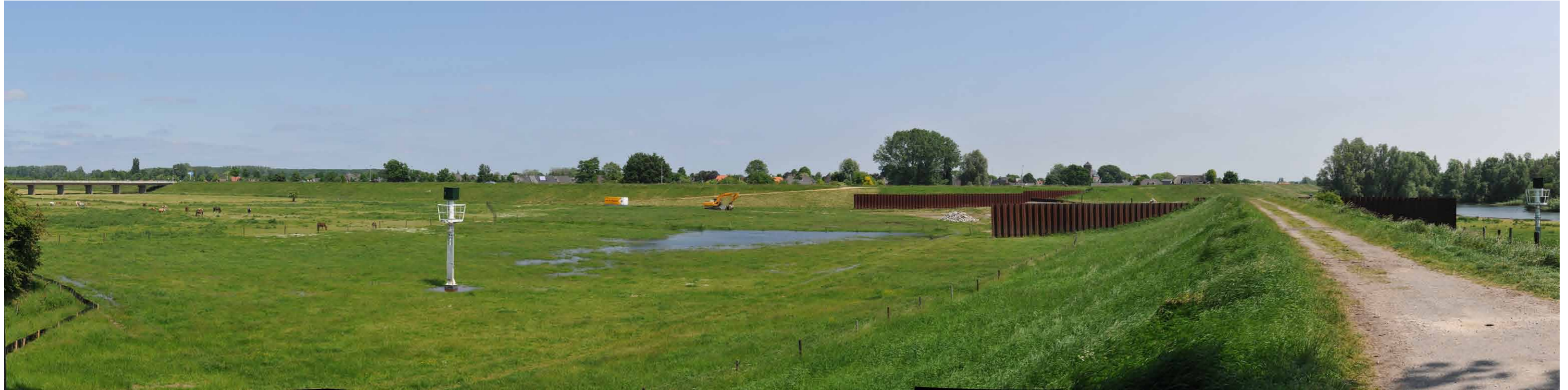
B 3 Regelwerk Pannerden, dam naar overlaat, 14 juni 2013