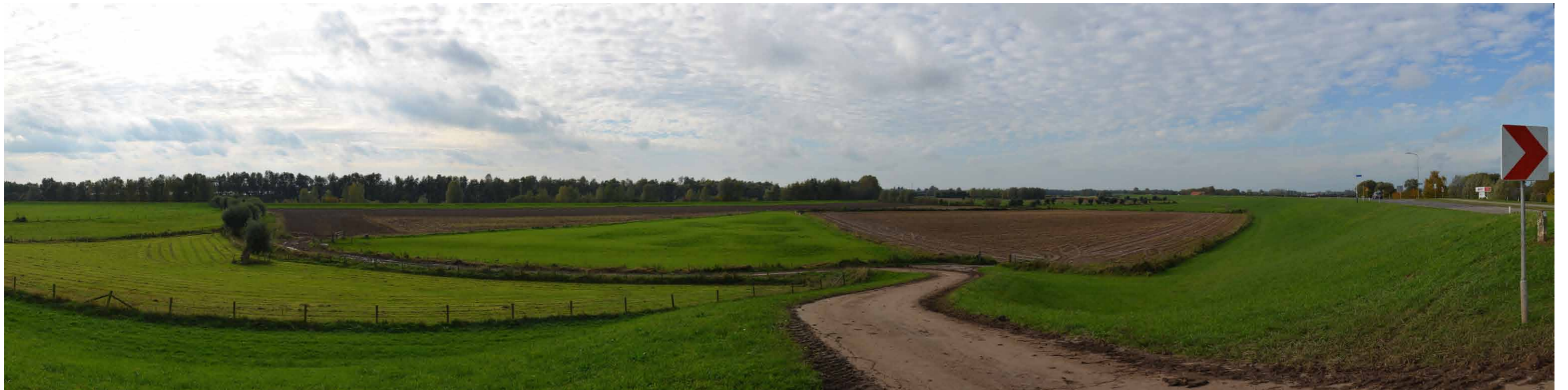
E 5 Gietenwaard, vanaf Pannerdensedijk, 26 oktober 2013