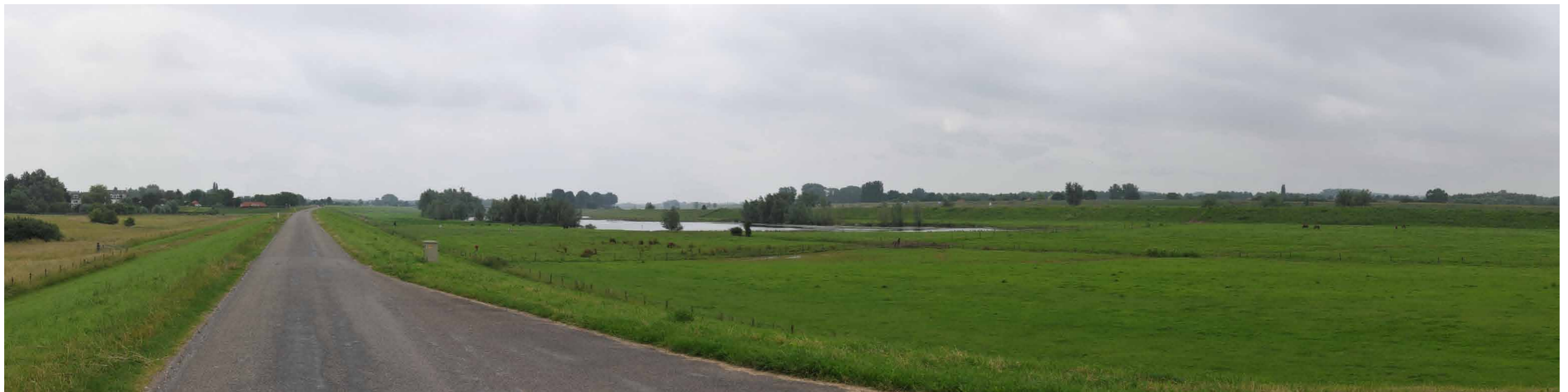
A 6 Groene rivier strang, Pannerdensche Waard, 1 juli 2013