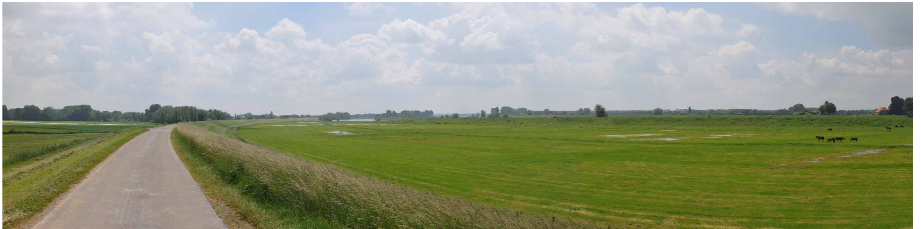
A 5 Groene rivier strang, Pannerdensche Waard 14 juni 2013