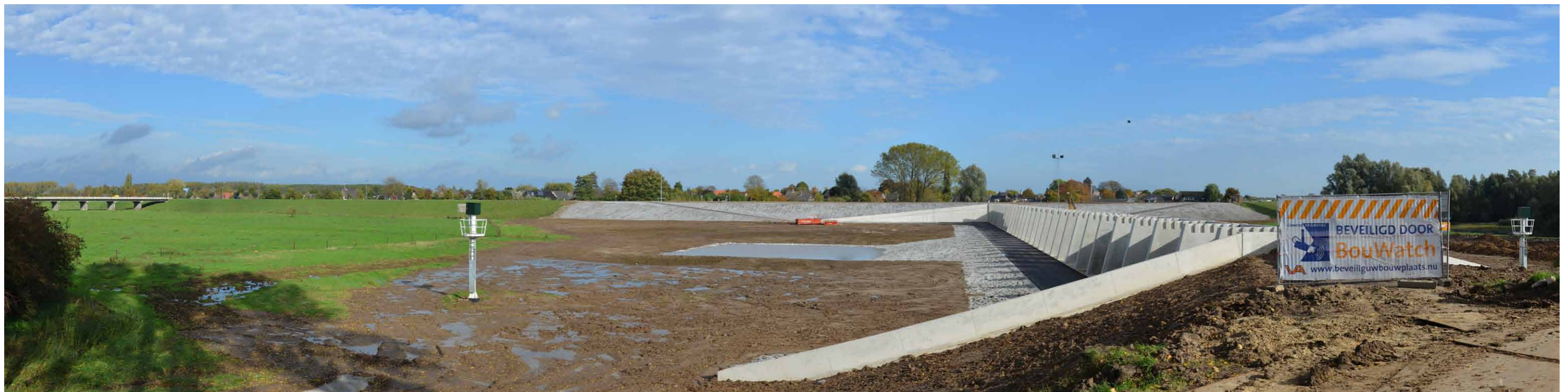
B 3 Regelwerk Pannerden, dam naar overlaat, 26 oktober 2013