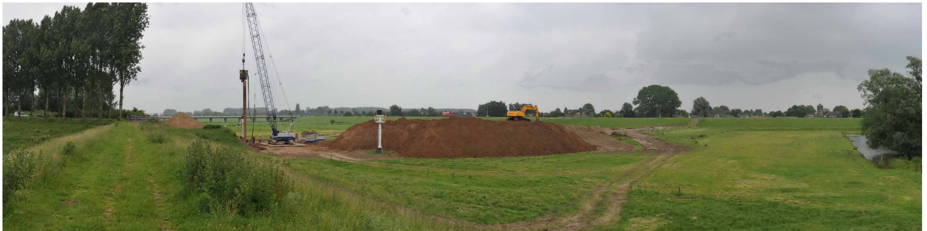
B 4 Regelwerk Pannerden, zomerdijk, 1 juli 2013