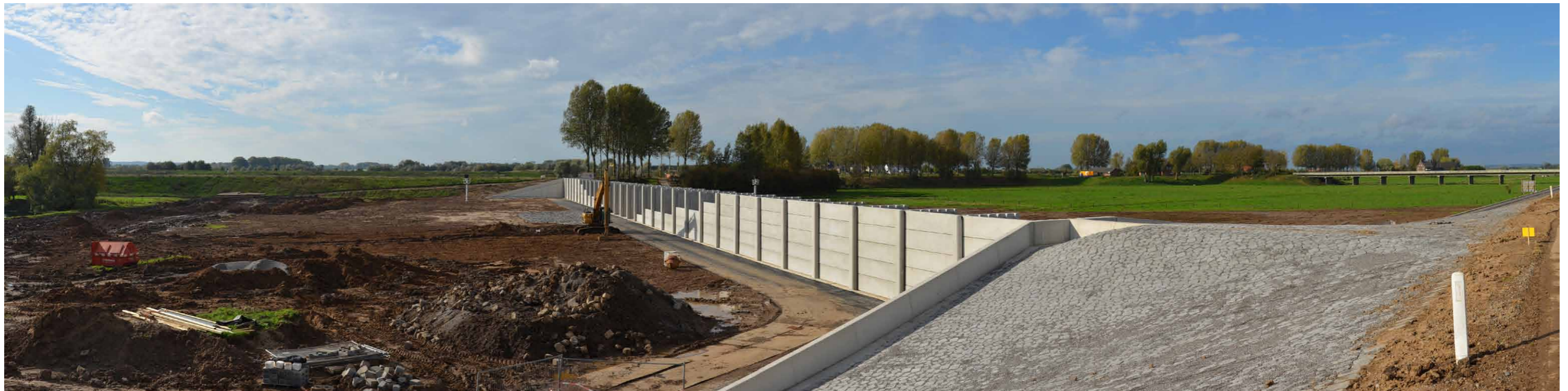
B 2 Regelwerk Pannerden, Rijndijk, 26 oktober 2013