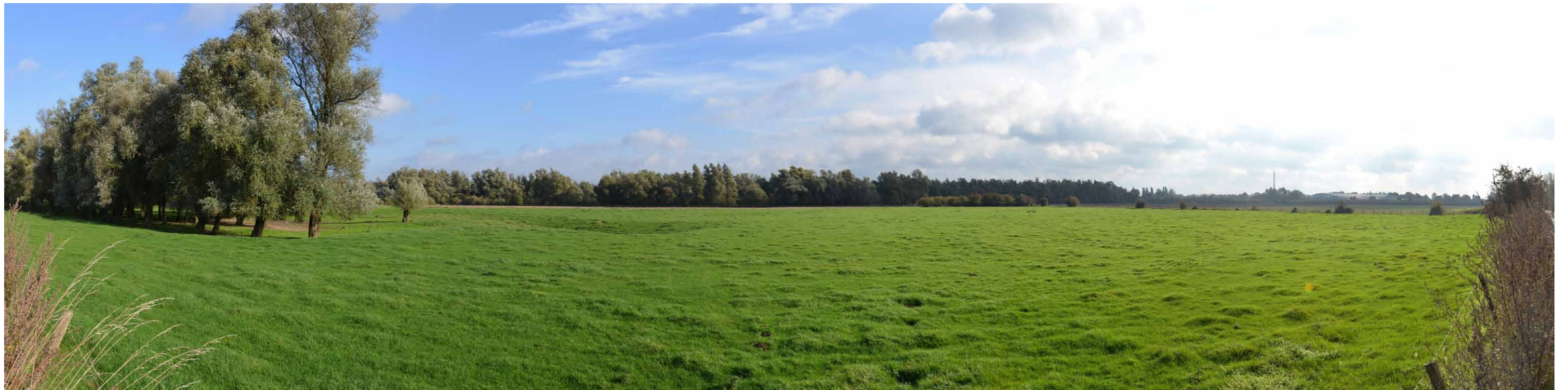
C 5 Lobberdenseweg, Kijfwaard, 26 oktober 2013