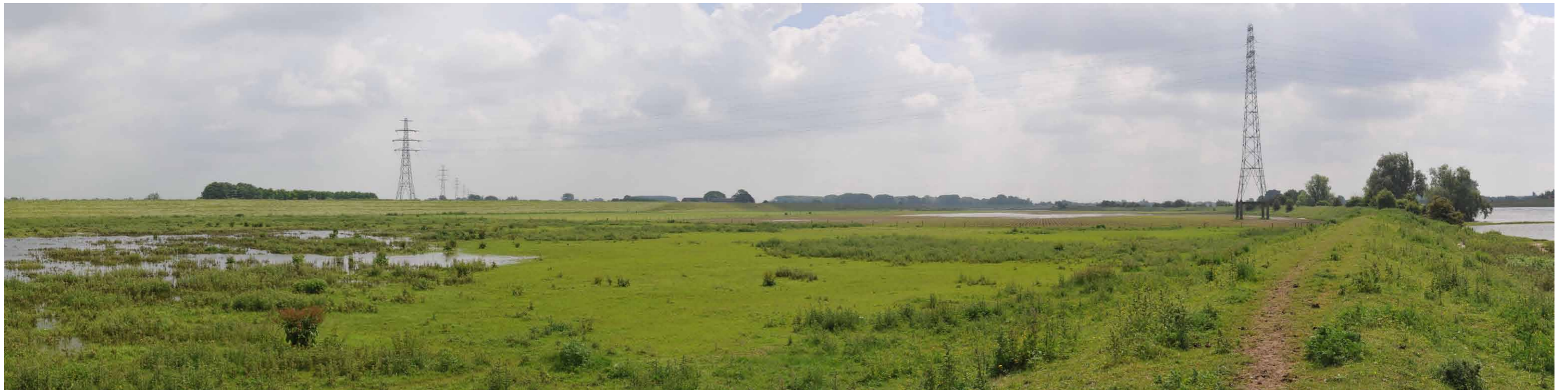
A 1 Groene rivier strang, zomerdijk, 14 juni 2013