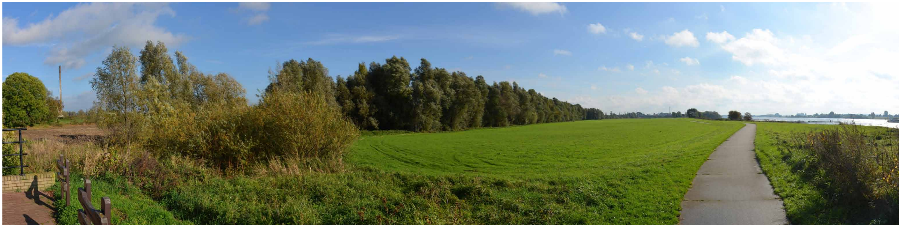
D 1 Oevergeul Boven-Rijn, bij Sluisje, 26 oktober 2013