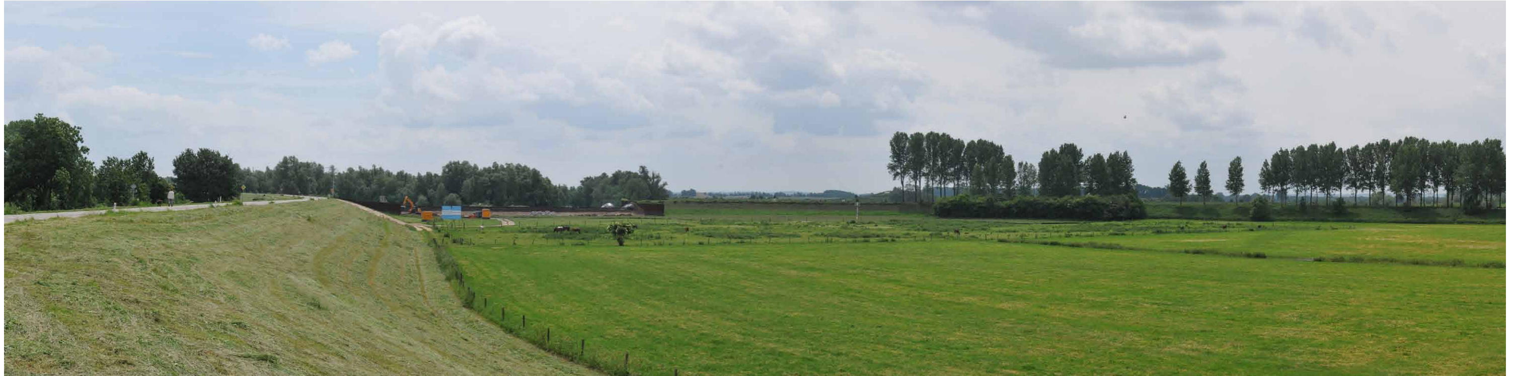
B 1 Regelwerk Pannerden, brug naar veer, 14 juni 2013