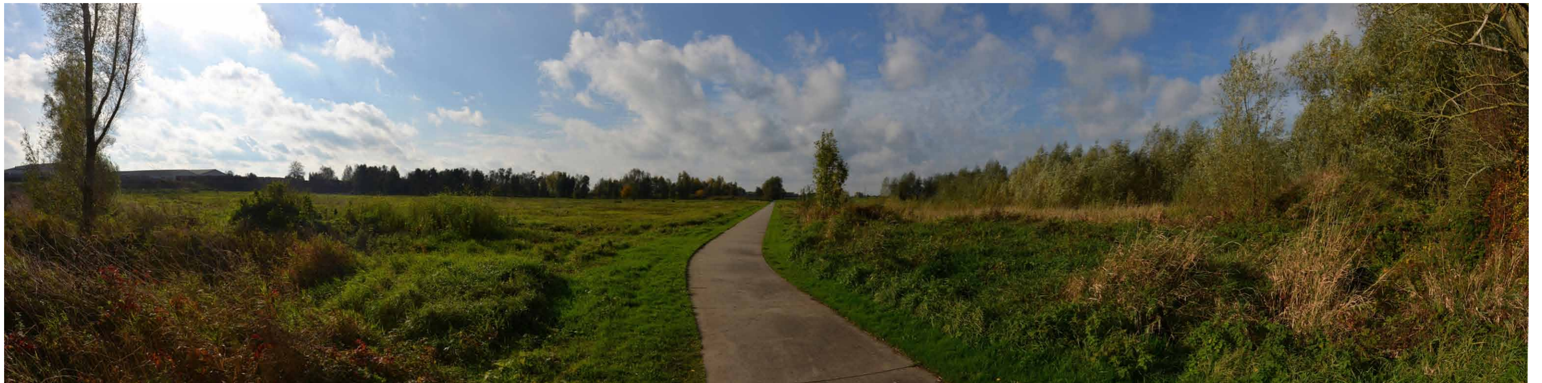
D 3 Oevergeul Boven-Rijn, Puttmanskrib, 26 oktober 2013