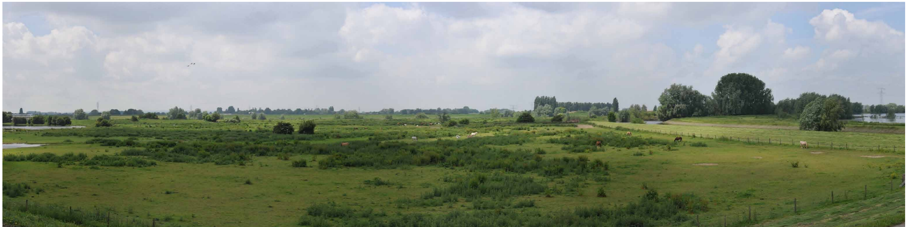
A 3 Groene rivier strang, Pannerdensche Waard, 14 juni 13